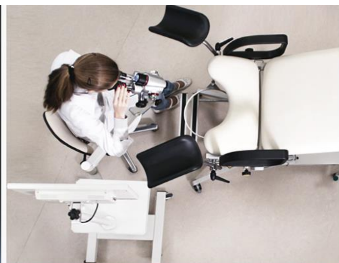
Compatible with all types of gynecological chairs