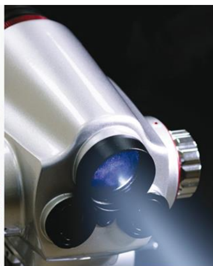
Lighting 25000 LUX