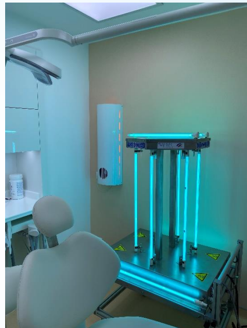
Abb. Zeigt das Produkt Siluxe 100 und 360 Grad Raumesinfektion in einer Zahnarztpraxis

IQ-Medicon ist der exklusive Vertriebspartner von Uvrer Anemo, Frankreich!