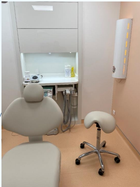
Abb. Zeigt das Produkt Siluxe 100 in einer Zahnarztpraxis

www.iQ-Medicon.de Mail: info@iq-medicon.de